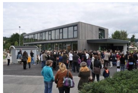
von links nach rechts: Schulhäuser Eichhölzli, Roggehuse, Feld

Für Menschen, die ihre Aus- oder Weiterbildung nicht selber finanzieren können, gibt es vom Kanton Stipendien (www.ag.ch) > Verwaltung > Departement Bildung, Kultur und Sport > Hochschulen .