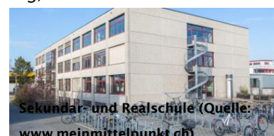
Sekundar- und Realschule

Für Menschen, die ihre Aus- oder Weiterbildung nicht selber finanzieren können, gibt es vom Kanton Stipendien ( www.ag.ch > Verwaltung > Departement Bildung, Kultur und Sport > Hochschulen ).