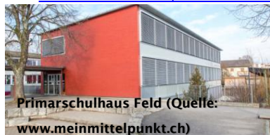
Primarschulhaus Feld

- Weiterführende-, Sonder- und Privatschulen in Aarau ( www.aarau.ch > Leben > Bildung )