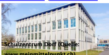
Schulzentrum Dorf